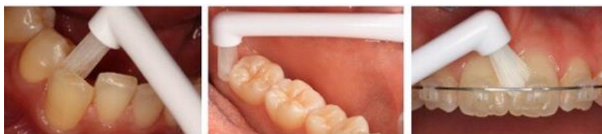
歯並びが悪いところ